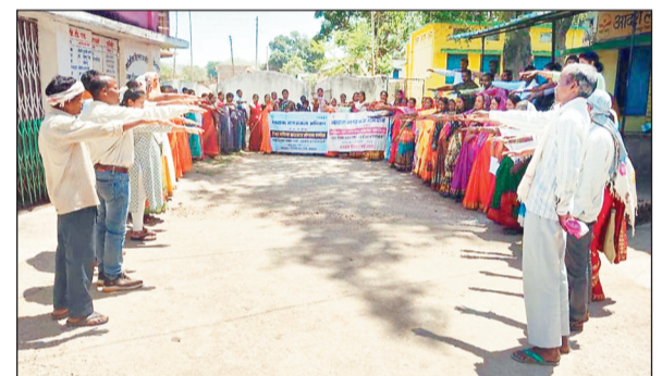
मतदाताओं को शपथ दिलाई गई।

जिले में स्वीप कार्यक्रम के तहत विभिन्न गतिविधियां जारी है। लोकसभा निर्वाचन 2024 में शत-प्रतिशत मतदान के लिए जिले भर में मतदाता जागरूकता अभियान चलाया जा रहा है। विभिन्न ग्राम पंचायतों की र व य स हा य ता समूह महिलाओं द्वारा सभी क्लस्टर में नए मतदाताओं को मतदान हेतु प्रेरित किया जा रहा है। इसी कड़ी में जशपुर ब्लॉक सहित अन्य ब्लॉक और ग्रामों में स्वयं सहायता समूह की महिलाओं ने मतदाता जागरूकता रैली निकालकर और रंगोली बनाकर मेहंदी लागकर लोगों को मतदान के प्रति जागरूक किया। हाथों में वोट देने की अपील की तख्तियां में वोट