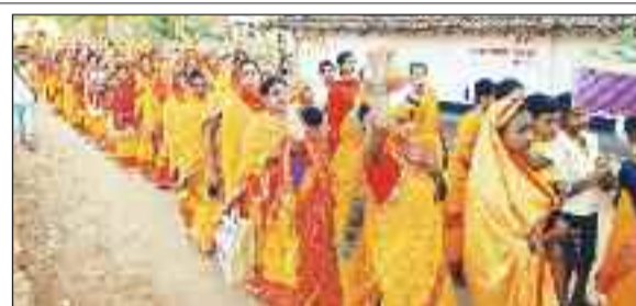
कलश यात्रा में शामिल महिलाएं।

बड़ी संख्या में लोग शामिल होकर श्री राम प्रभु की जयकारा लगाते दिखे। रामनवमी महोत्सव के अवसर पर यहां के गरियादोहर में भव्य कलश यात्रा निकाली गई, जिसमें बड़ी संख्या में महिला पुरुष शामिल हुए। इस अवसर पर महाकुल समाज द्वारा बजरंग बली मंदिर प्रांगण में अष्ट प्रहरी अखंड कीर्तन का आयोजन किया गया। झांडे लेकर मंदिर प्रांगण से निकाली गई कलश यात्रा मुख्य बस्ती होकर मैनी नदी तट पहुंची, वहां से वैदिक मंत्र उच्चारण कर कलश में पवित्र जल भर कर पुनः