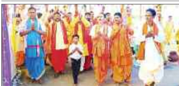
जय श्रीराम का नारा लगाते श्रद्धालु।