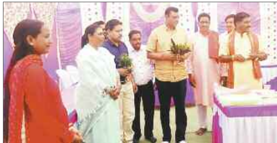
रामनवमी महोत्सव में शामिल विधायक गोमती व अन्य।