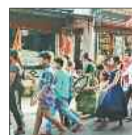
रैली में शामिल बच्चे।

जशापुरनगर। नारायणपुर में रामनवमी की शोभा यात्रा धूमधाम व भव्य तरीके से निकाली गई। जुलूस में जय श्री राम व जय जय हनुमान के नारों से नारायणपुर गुंजता रहा। रामनवमी में राम भक्तों ने काफी जोश के साथ इस वर्ष कुछ नया कर दिखाया। चारों ओर जय श्री राम के नारे गुंज रहे थे जुलूस में भारी संख्या में महिलाएं और बच्चे भी हुए शामिल। रामनवमी की शोभा यात्रा पूजा पाठ के बाद शाम 5 बजे शिव मंदिर परिसर से निकाला गया। इसके बाद शोभा यात्रा कन्या शाला, ग्रामीण बैंक अटल चौक पहुंची। डीजे के धुन में झूमते जय श्रीराम का नारा लगाते बस्ती के मुख्य मार्ग से होकर जय स्वस्तिम चौक पहुंचे वहां भी बजरंग बली के झंडे का विधिवत पूजा किया गया। वहां पूजा अर्चना के बाद नृत्य करते राम भक्त श्री सर्वेश्वरी आश्रम पहुंचकर वहां विधि विधान से पूजा अर्चना किए। नारायणपुर मंडली डीजे की धुन पर लोग झूमते रहे। जुलूस में शामिल लोग राम लखन जानकी जय बोलो हनुमान की, जय श्री राम धार्मिक जयकारा लगाते हुए चल रहे थे लोगों के बीच शरबत व चना का वितरण किया गया। इस जुलूस में गांव के ग्रामीण और भारी संख्या में महिलाओं की उपस्थिति रही।