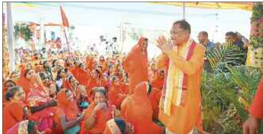
बगिया में महायज्ञ के समापन मौके पर उपस्थित मुख्यमंत्री साय।