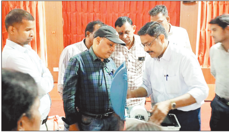
प्रशिक्षण देने अधिकारी।

निर्वाचन से संबंधित कार्यों का कराया गया बोध जिपं सभाकक्ष में आयोजित किया गया प्रशिक्षण